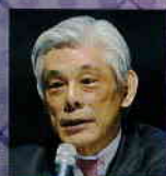
近藤 誠一 近藤文化・外交研究所代表 前文化庁長官