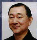
河村 晴久 翻世流能楽師