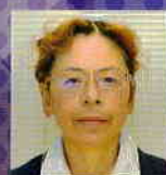
高村 薫 作家